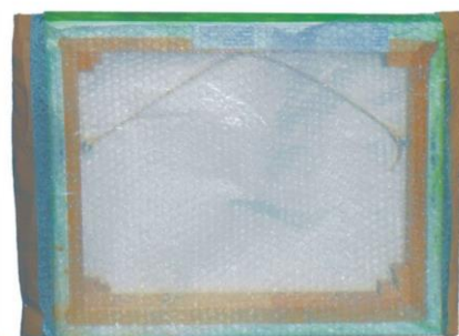
Protection: papier bulle plié en deux et scotché sur 2 côtés. 1 ouverture libre