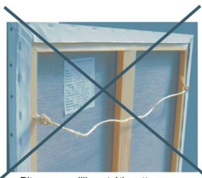
Pitons en saillies et étiquette au format non conforme