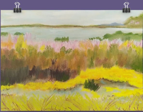
Retour de vacances (pastel) André Wall-Bonet