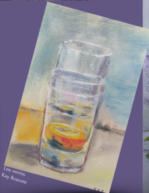
Les verres Kay Bonomi